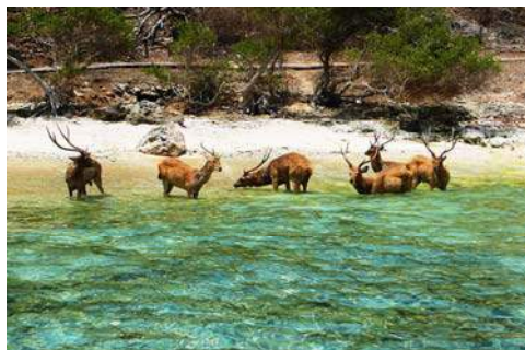
Lovina Beach bezaaid met bloemen en herten op het strand nabij Pemuteran (foto's Monique Hoveling)

De buitenlandse inmenging kan in dit geval goed bijdragen tot het behoud van de enorme schoonheid van Bali. En dat is niet onbelangrijk gezien de aantallen bezoekers. Gelukkig blijkt er ook organisch "afval" op de stranden te liggen (zie foto's).