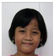
Laluna 2 mei 11 jr.