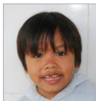
Rossa 5 maart 6 jr.