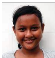
Jesicha 3 januari 12 jr.