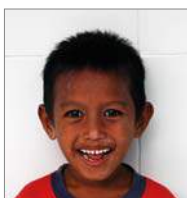
Kevas 2 januari 4 jr.