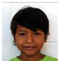
Febe 10 februari 7 jr.