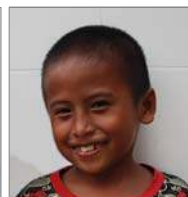
Terios 18 maart 7 jr.