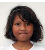
Marssandra 28 augustus 11 jr.