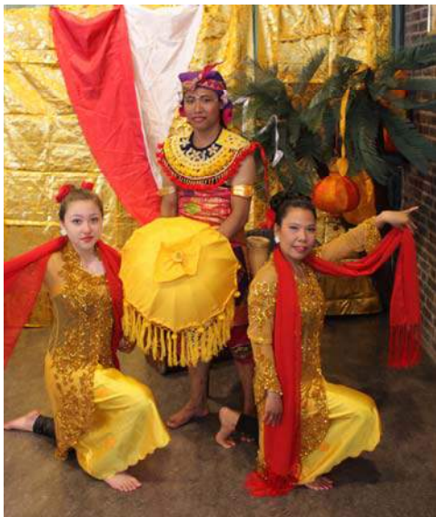
Team Smaragd Feestdag 2014