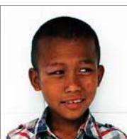
Chalvin 6 september 9 jr.