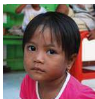
Happy 30 december 3 jr.