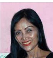
Sri In oktober 47 jr.