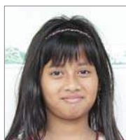
Eurika 1 juli 14 jr.