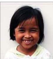
Chapella 11 november 7jr.