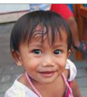
Lotus Nathalie 12 december 1 jr.