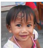
Lotus Nathalie 12 december 2 jr.