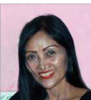
Sri In oktober 48 jr.