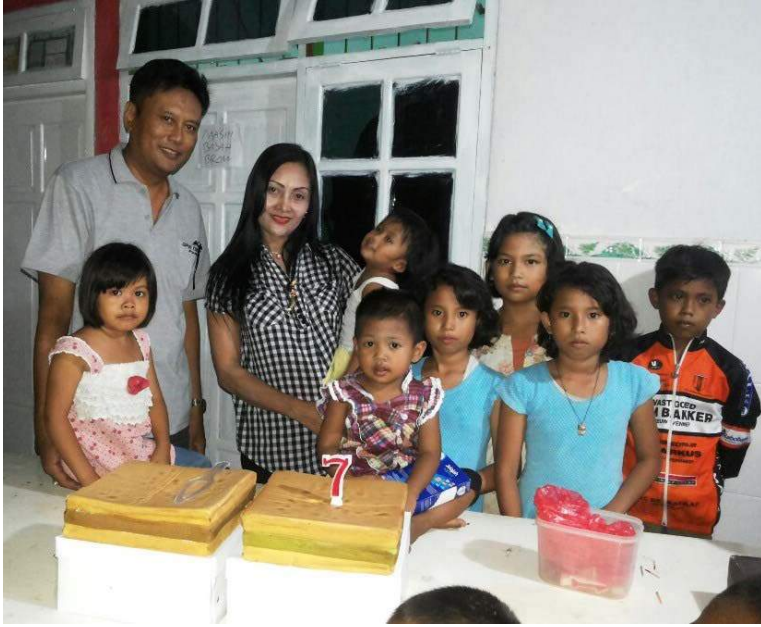
jarige jobs maart 2015