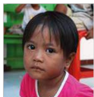
Happy 30 december 4 jr.