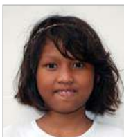
Marssandra 28 augustus 12 jr.