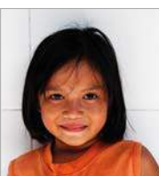
Rizya 23 juli 8 jr.